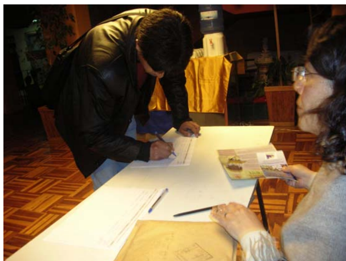
Registro de participantes